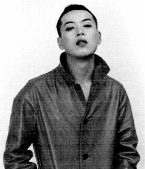
図2 鷹野隆大《赤い革のコートを着ている》シリーズ〈IN MY ROOM〉より 2002年(原画はカラー)