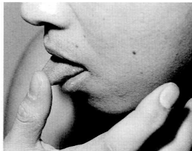
図3 藤野隆大 シリーズ《An Ignition Point》より 2010年(原画はカラー)